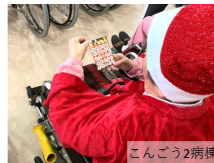
こんごう2病棟 ビンゴ大会

工夫を凝らしたレクリエーションをお楽しみいただき、クリスマスケーキをお召し上がりいただきました。