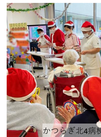
かつらぎ北4病棟 ハンドベル演奏