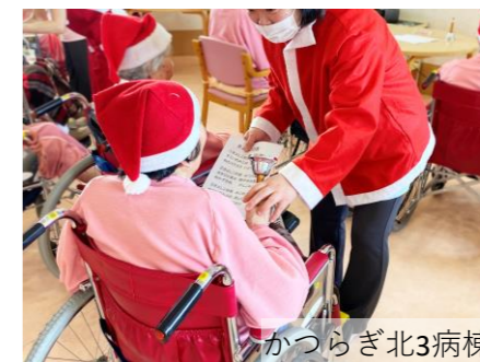
かつらぎ北3病棟 ハンドベル演奏