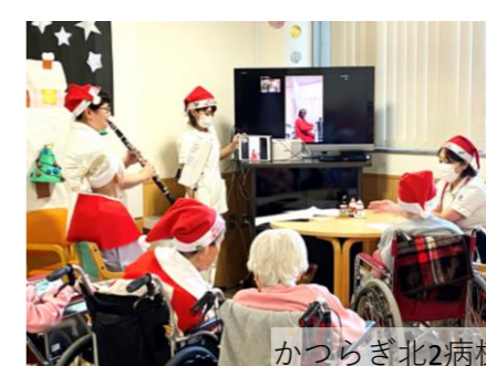
かつらぎ北2病棟 音楽会