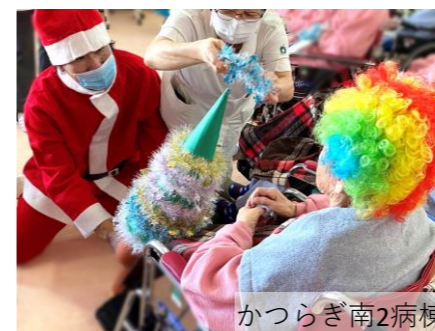
かつらぎ南2病棟 ツリー作り