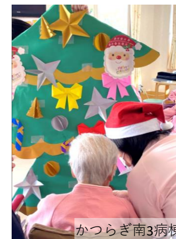
かつらぎ南3病棟 ツリー飾りつけ