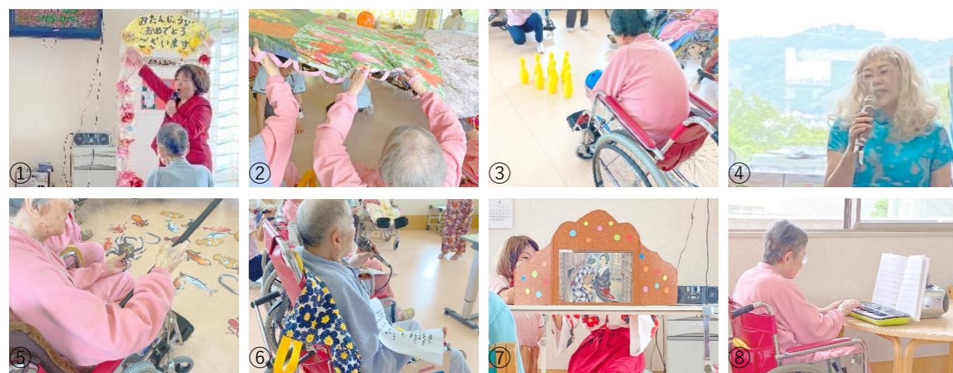
上段左から①カラオケショー(かつらぎ南4病棟)、②ボール遊び(こんごう2病棟)、③ボーリング(かつらぎ北2病棟)、④カラオケショー(かつらぎ北4病棟)、⑤魚釣り(かつらぎ南2病棟)、⑥誕生日の歌のプレゼント(かつらぎ南3病棟)、⑦紙芝居(かつらぎ南4病棟)、⑧テレビアニメのテーマ曲演奏(かつらぎ北2病棟)

〈編集後記〉記念植樹で植えたセイヨウカマツカは、春には白い花が咲き、秋には赤い実がなるそうです。今年の秋、来年の春が楽しみです。花や実の様子は、当院のホームページやInstagramでご紹介する予定です。どうぞお楽しみに。 広報室 上谷紀香