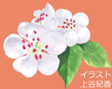
イラスト 上谷紀香