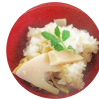
筍ご飯 木の芽添え

広島、兵庫、三重と変えていき、5月上旬の長野県産まで続きます。筍ご飯に若竹煮、木の芽和えなど色々な筍料理をお楽しみいただいています。