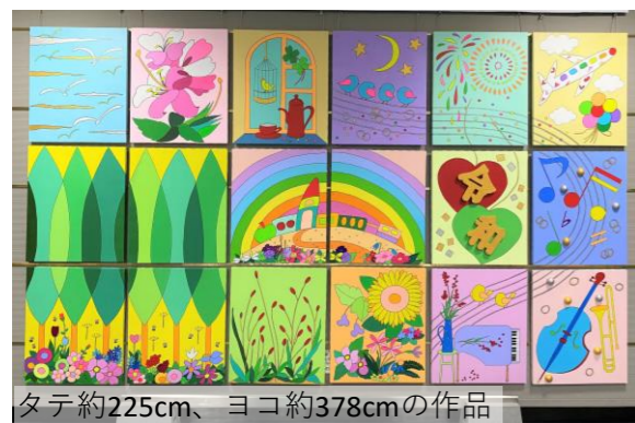
タテ約225cm、ヨコ約378cmの作品

正面エントランスの大きな絵は「ペイント・イン」という手法で、毎年「敬老の日」に患者さま、ご家族さま、スタッフが参加して描きました。現在はタイトル「こころの絵日記」を掲示しております。いま新しい絵を作成中です。完成しましたら、ホームページなどでお知らせいたしますのでぜひ楽しみにお待ちください！