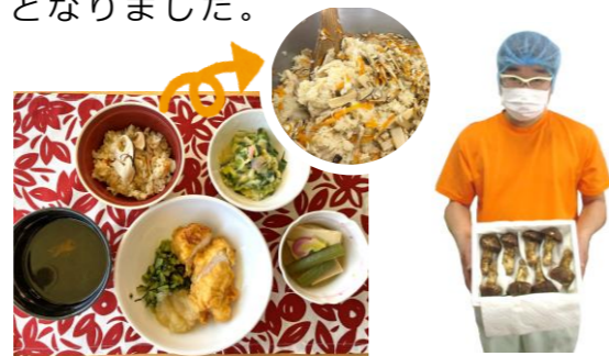
松茸ごはんでご提供した日のメニューです。