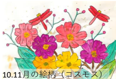
10.11月の絵柄（コスモス）