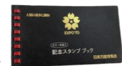
大阪万博スタンプブック