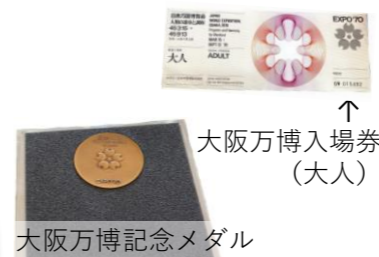
大阪万博記念メダル