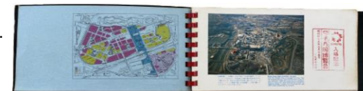
左には会場案内図、右にはスタンプ帳