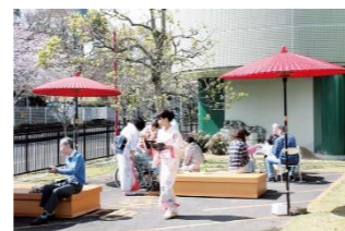
桜まつり開催風景

当院の三大まつりのひとつ「桜まつり」は、本年も開催を見合わせる事となりました。コロナ禍が収束した暁には再開させていただきます。ご理解賜りますようお願いいたします。