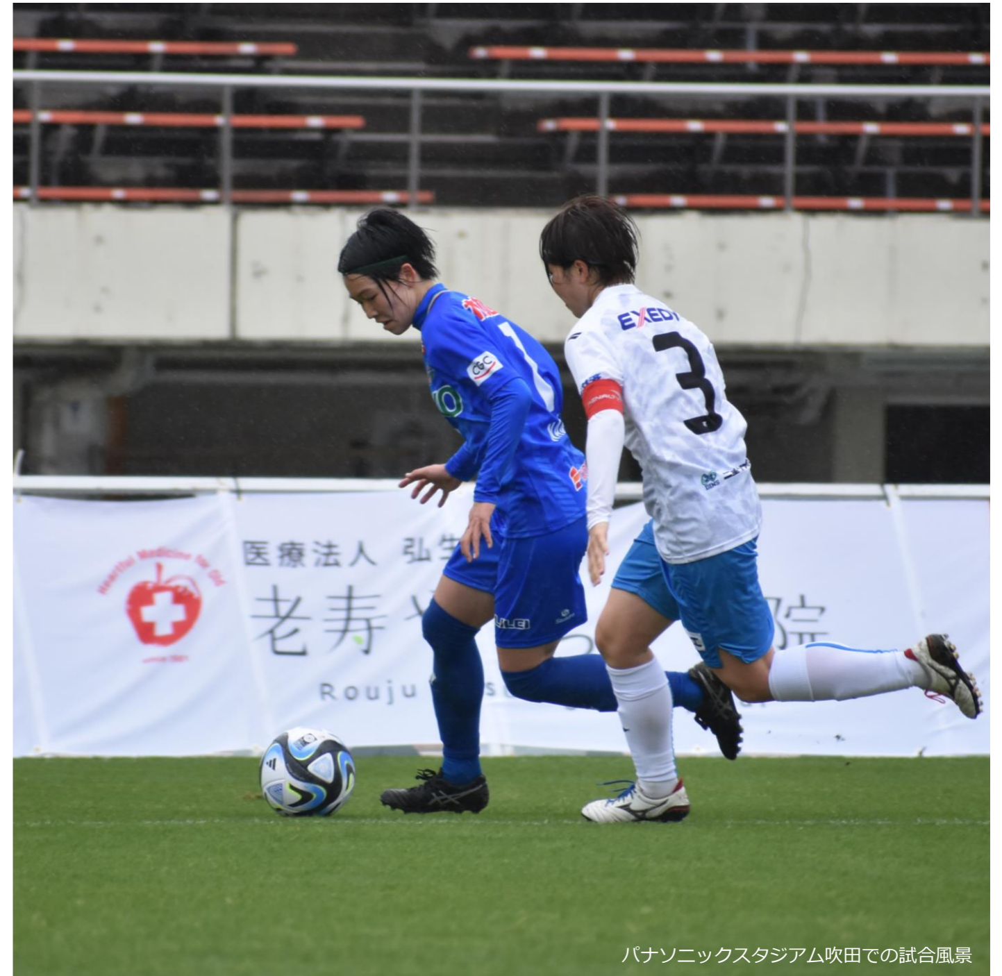
パナソニックスタジアム吹田での試合風景

当院から見える山並みの新緑が美しい季節となりましたが、皆さまいかがお過ごしでしょうか。さて、今月の『やすらぎ便り』では、当院がオフィシャルスポンサーになった女子サッカーチームの紹介記事や、新病院名お披露目の際に患者さまにお召し上がりいただいた記念料理、新任看護部長のごあいさつなどを掲載いたしております。ご高覧いただければ幸いです。