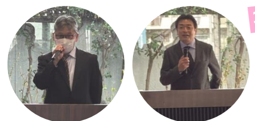
3月1日(金) 理事長(左) 院長(右)が ごあいさつ