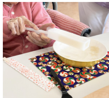
おやつ会（ところてん） こんごう 3 病棟