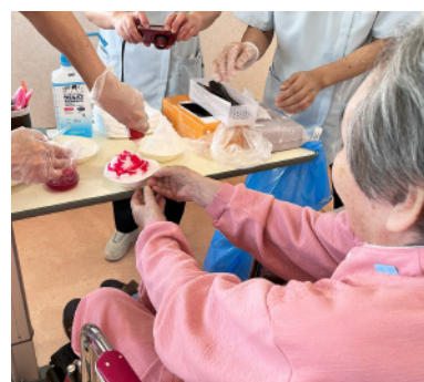
かき氷 かつらぎ北 3 病棟