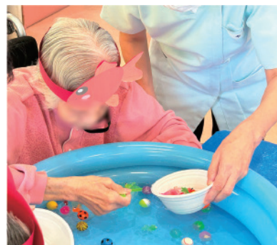
金魚すくい かつらぎ南 2 病棟