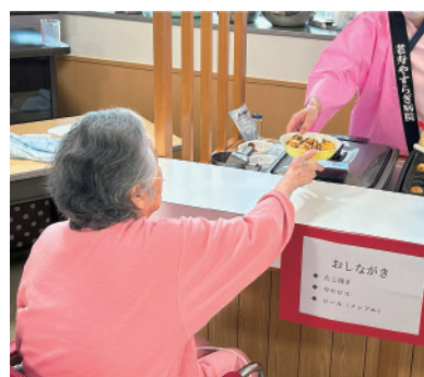
夏まつり かつらぎ北 4 病棟