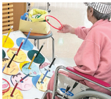
縁日 こんごう 2 病棟