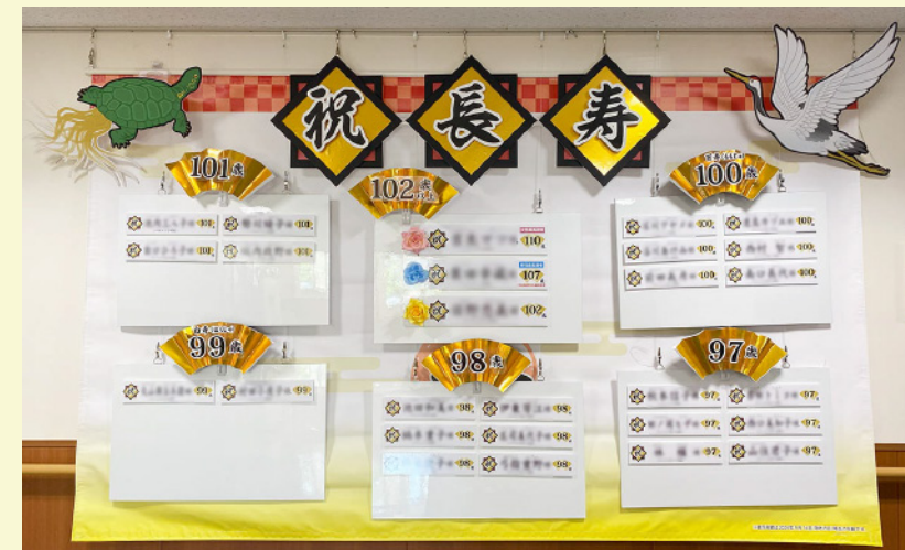
2024 年度の タペストリー

年齢の扇プレートは 取り外しできるので 手に持って写真の撮 影にご利用ください。